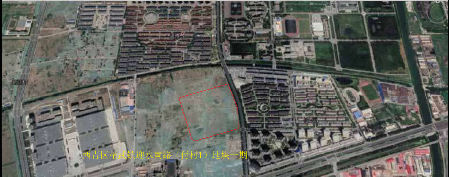
西青区精武镇迎水南路（付村1）地块一期